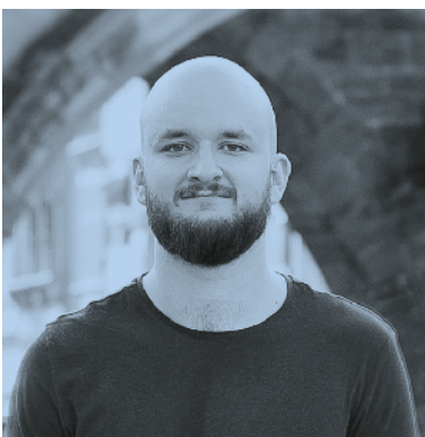
Jan Pokorný (Pokáč)

Největší a zároveň jediný kulturní zážitek pro mě byl, když jsme během jarní karantény sjeli doma na plátně komplet